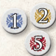
24 büntetőpont jelző („1”-es, „2”-es és „5”-ös)