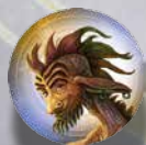
SVINDLER JELZŐ HÁTOLDALA

Ezeket a jelzőket csak akkor kell használni, ha a Svindler faj játékban van. A jelzők közül hat üres, egynek az elején pedig egy „X” jel található, mely azt mutatja, hogy a Svindler melyik játékost „jelölte meg”. A jelzők használatáról a Svindler fajlap ad átfogó leírást.