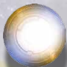
SVINDLER JELZŐ ELEJE