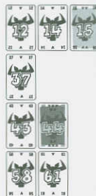
Ábra 2: sorok az első forduló után.

Példa: Ahogy azt az 1 ábra mutatja a kezdő lapok értékei a következők: 12,37,43,58. A négy játékos a következő lapokat játssza ki: 14,15,44,61. Az elsőként beilleszthető lap a 14, mert ez a legalacsonyabb értékű lap. A szabályban leírtak szerint a 14 értékű lap csak a 12 után illeszthető be, ezt követi a 15 értékű lap. A 44 értékű lap az első szabályban leírtak szerint az első és a második sorba is beilleszthető lenne, de a második a legkisebb különbség szabály miatt csak a harmadik sorba illeszthető. A 61 értékű lapot a második szabály meghatározása szerint a negyedik sorba lehet beilleszteni.