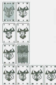
Ábra 4: sorok a harmadik forduló után.

A legalacsonyabb értékű lap a 3-as. Ezt a lapot kell elsőként beilleszteni a sorokba, de egyik sorba sem illeszthető be. Ezért annak a játékosnak, aki a 3 értékű lapot kijátszotta egy meglévő sort ki kell ürítenie. A játékos a második sort választja és a 37 értékű lapot felveszi, majd az általa kijátszott 3 értékű lappal egy új második sort képez. Az a játékos, aki a 9 értékű lapot kijátszotta szerencsés helyzetbe került, lapját a 3 értékű lap mellé illesztheti a második sorba.