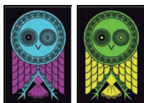
Nincs egyező szín

A játék menete: A legfiatalabb játékos kezd. Amikor sorra kerülsz, a saját lapjaid közül a játéktér közepére tehetsz egyet, kettőt vagy hármat, képpel felfelé. Csak akkor tehetsz le egy lapot egy másik mellé, ha a baglyok legalább egyik színe megegyezik.