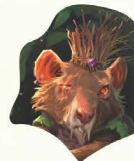
I VARJÚHAJ LAPKA