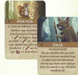
15 KÜLÖNLEGES KÉPESSÉG KÁRTYA