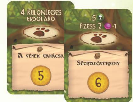
9 KÜLÖNLEGES ESEMÉNYKÁRTYA