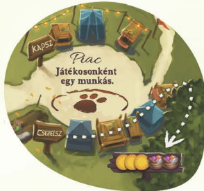
I PIAC TÁBLA