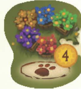
I VIRÁGFESZTIVÁL ESEMÉNYLAPKA