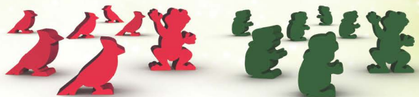
12 ERDŐLAKÓ (6 KARDINALISPINTY, 6 VARANGY) ÉS 2 BÉKA NAGYKÖVET