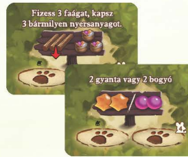
4 ERDEI TISZTÁS KÁRTYA