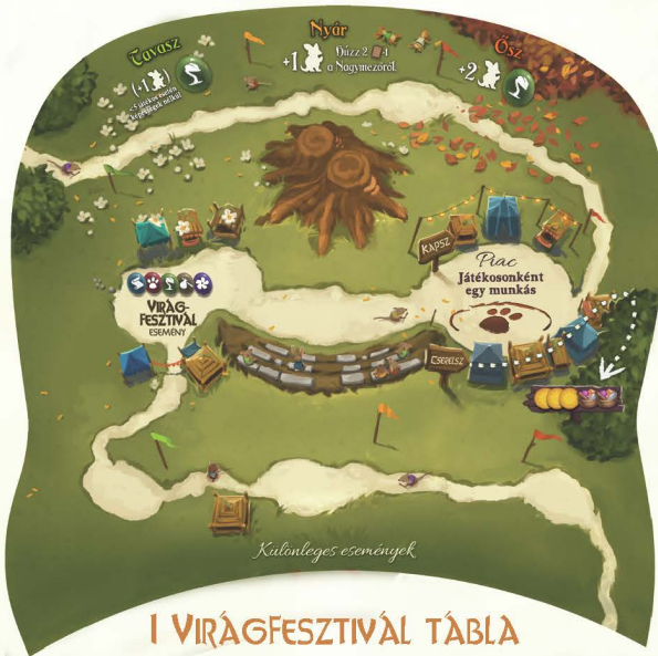
I VIRÁGFESZTIVÁL TÁBLA