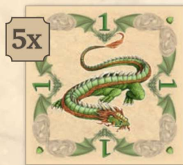
Smaragd sárkány (értéke: 1)