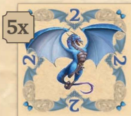
Zafir sárkány (értéke: 2)