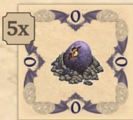
Sárkánytojás (értéke: 0)