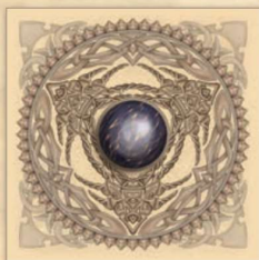
A kártyák hátlapja