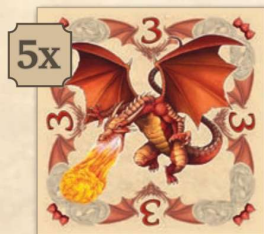
Rubint sárkány (értéke: 3)